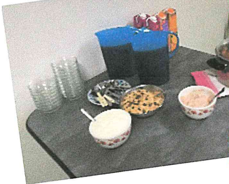
Den Abschluss bildete ein gemeinsames Frühstück mit gesunden Lebensmitteln